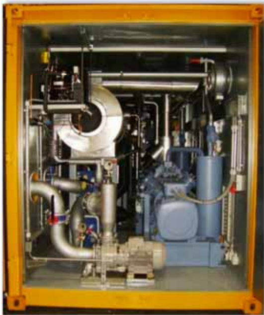
40' Container mit CO 2 / NH 3 -Erdgefriercontainerkälteanlage