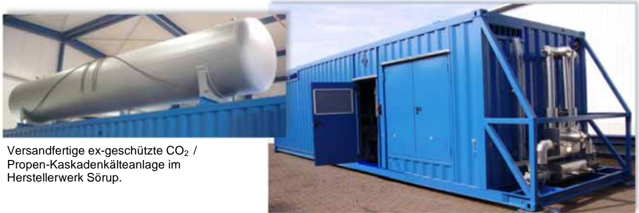
Versandfertige ex-geschützte CO 2 / Propen-Kaskadenkälteanlage im Herstellerwerk Sörup.

Die Verflüssigung der oberen Kaskadenstufe erfolgt durch Kühlwasser aus dem zentralen Werksnetz des Betreibers.